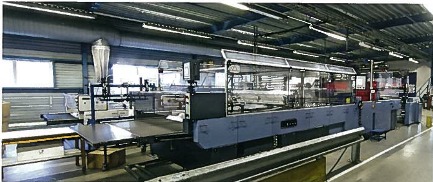
De conversielijn voor zakken bij OPI.